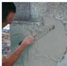
Réalisation d'un sous-enduit