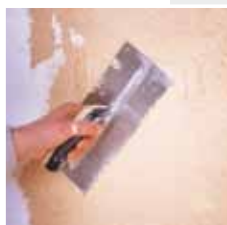
Application du CRÉPIMUR au platoir inox