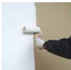
Application du CRÉPIFOND G